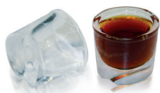
EC 206 ICE SHOT Ice Shot 40 g Ø 44 x H 46 mm