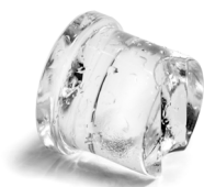
EC XL 206 Gourmet ijsblokje Extra Large 60 g Ø 44 x H 46 mm